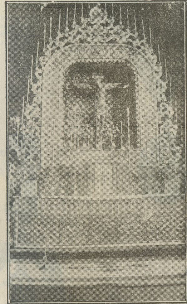
Severo retablo de plata repujada del Siglo XVIII en el que se venera la Sagrada Imagen.