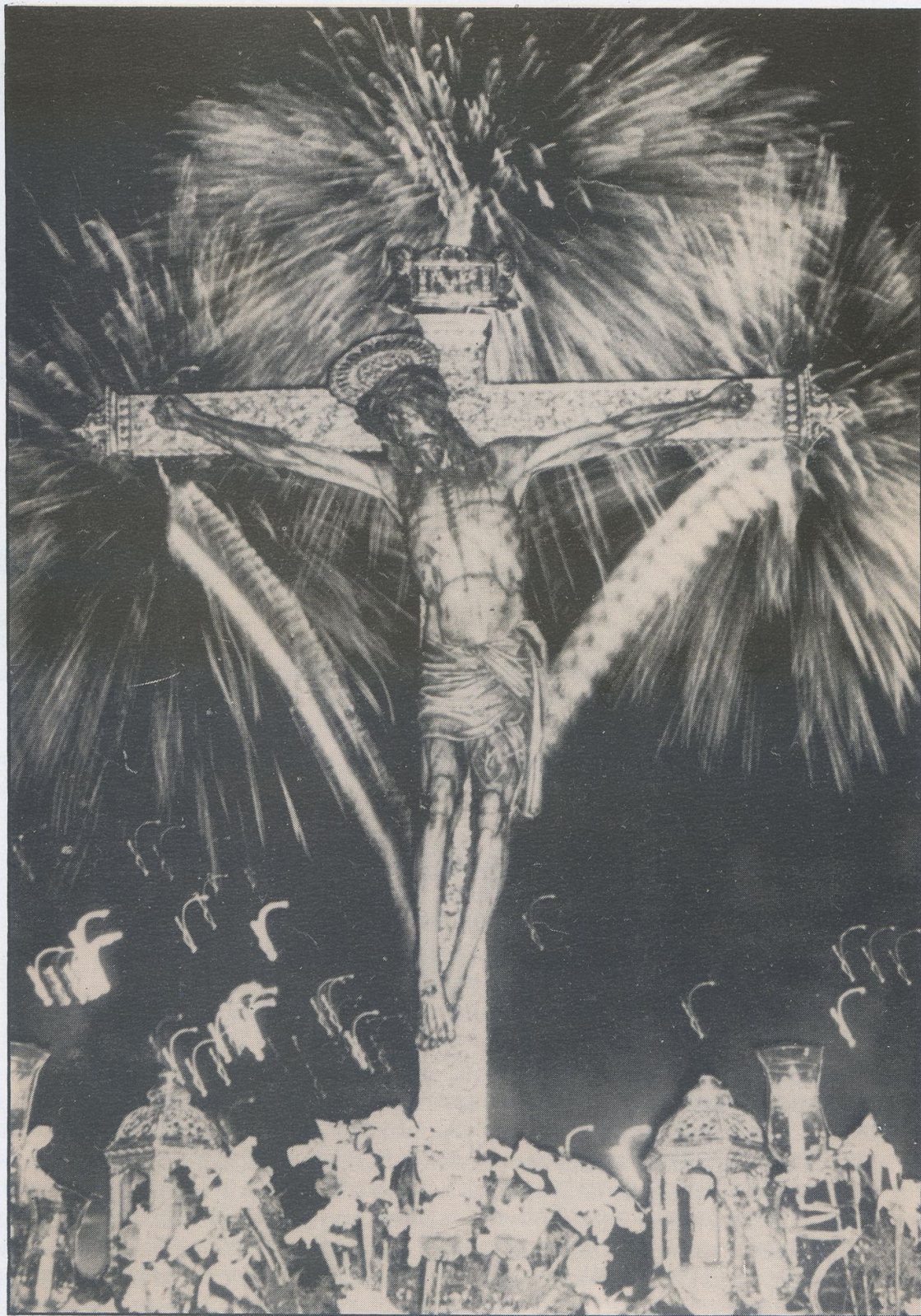
La palmeras de luz abrazan al Cristo, llamándole al aire entrañable de las noches de «su Laguna».